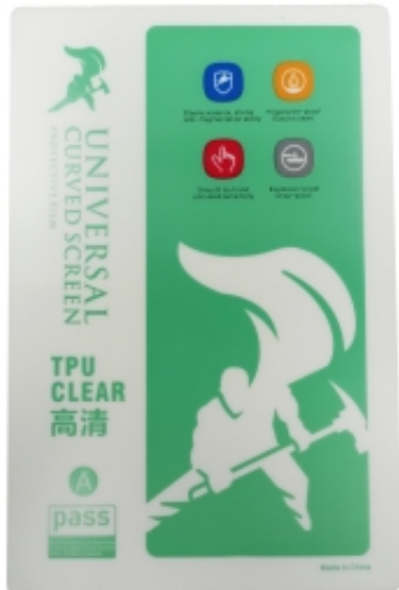
LÁMINA PROTECTORA TPU TRANSPARENTE PARA TELÉFONO 10unid.

Enlace al producto: https://cncworld.es/lamina-protectora-tpu-transparente-para-telfono-10unid-p-788.html